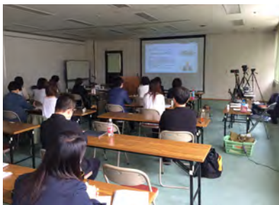
年次総会 (ハイブリッド)