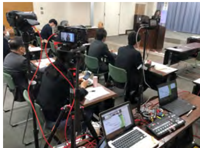
経営者セミナー (ハイブリッド)