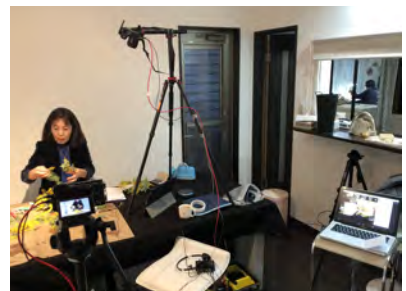
フラワーレッスン (オンライン)