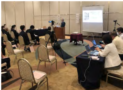
経営者セミナー (ハイブリッド)