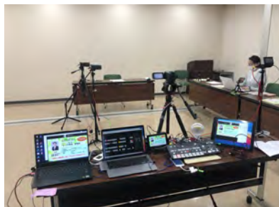
セミナー (オンライン)